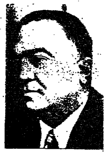
ج. ادغار هوفر مدير مكتب التحقيق الاتحادي

تقرير مدير مكتب التحقيق الاتحادي عن حركة لتجريب واشنطن - رويتر - ادعى المشرع ج. ادغار هوفر مدير مكتب التحقيق الاتحادي ان أعمال عنف كثيرة قام بها الشيوعيون في الولايات المتحدة من تنظيم قوة خريبية. وقال ان القوة التي تزود عددا كبيرا من اليسار الجديد وان عضوا حثيثة تعرف باسم "طالب المجتمع الديمقراطي". وقال المشرع هوفر في التقرير السنوي لكاتب التحقيق الاتحادي ان الشيوعيين في الولايات المتحدة قاموا بعمليات عنف كثيرة في السنوات الأخيرة كما هي ملازمة لثقافة الخط الشيوعي القديم الذي عمل لسنوات عديدة لتسليح هذا الوطن من الداخل. وقال المشرع هوفر ان ذلك كان واضحا بنوع خاص في اجتراح طلاب